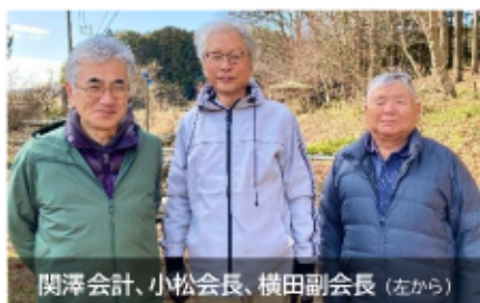
関澤会計、小松会長、横田副会長 (左から)