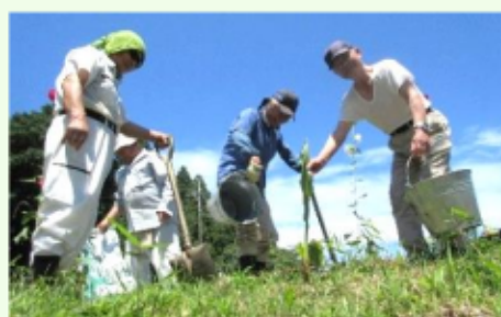
「ホトメの里」の環境整備