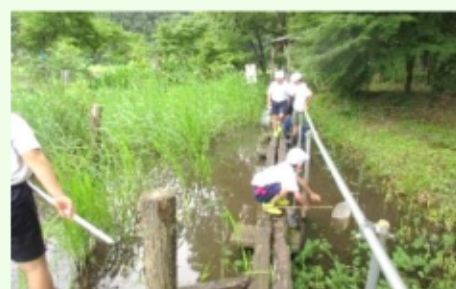
校外学習の受け入れ