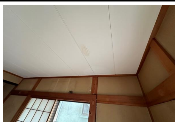
1階和室天井に雨漏りの影響を受けている箇所あり