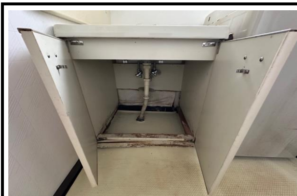
洗面台の下部修善の必要あり