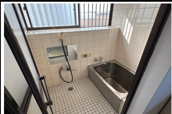
浴室 (ドアの交換の必要あり)