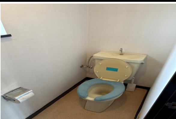
トイレ(床の修善が必要)