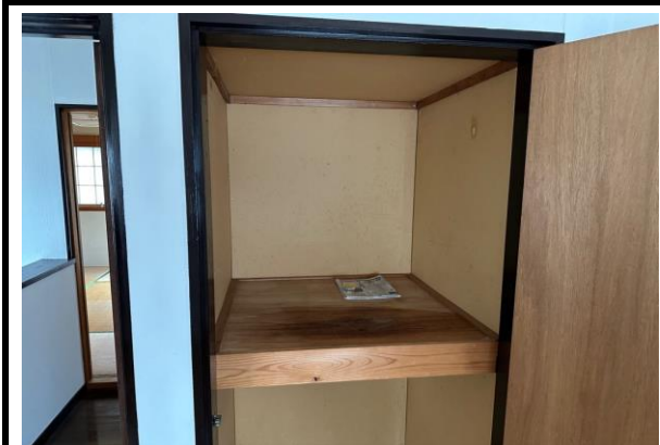
2階洋室の収納スペースから雨漏り