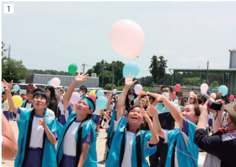
1 150周年記念バルーンリリース