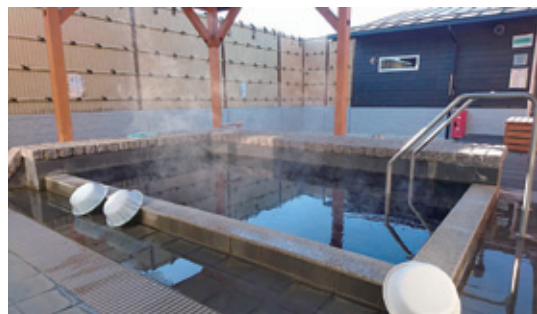
小美玉温泉湯～GO! (小美玉温泉ことぶき)の露天風呂