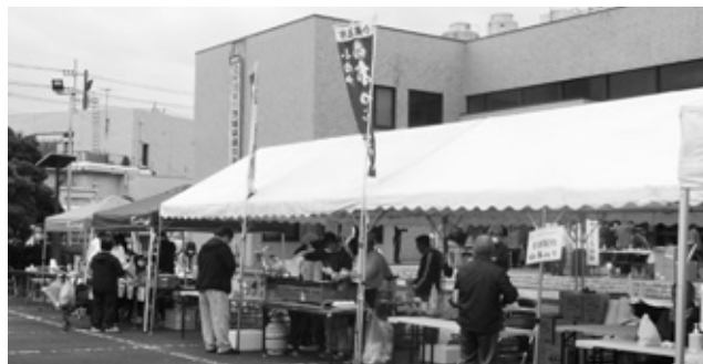
住みよい堅倉地区をつくる会「かたくら朝市」(令和4年度)

市民主体のまちづくりのさらなる推進のため、市が認定するまちづくり組織に対して、活動費補助などの支援をしています。ぜひ、皆さんの思いやアイデアを実現するため、補助金を活用ください。