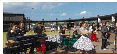
1/29 (日) Hap's & A.MB

イベントの様子をスタッフが撮影し、ホームページや市の発行物に掲載する場合があります。イベントは天候やその他の状況により中止や変更になる場合があります。写真やイラストはイメージです。