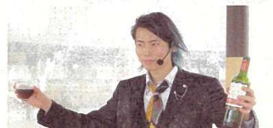
1/8 (日) AKIRA