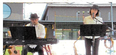
1/28 (土) ANAK