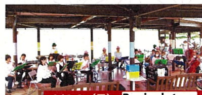
1/22 (日) Brighten