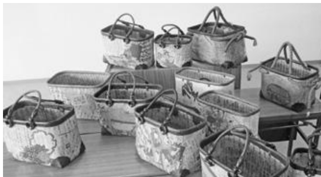
一閑張の手さげかご

美野里地区の5つの公民館で実施した市民講座の作品を展示します。受講生の精魂込めた力作をご覧ください。