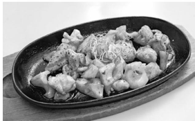
とんかつ美沢 「鶏と蓮根の鉄板焼」