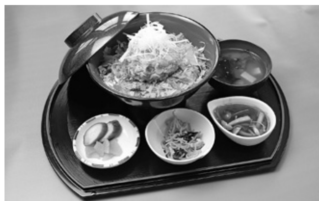
橋本旅館 「れんこんととり肉団子のきの子あんかけ丼」

日本一の生産量を誇る霞ヶ浦の「れんこん」をより美味しく、身近に食べていただくため、れんこん料理フェアを毎年開催しています。フェア実施期間中、霞ヶ浦の周辺市町村の飲食店でれんこん料理を味わえます。市内では2店舗がれんこん料理を提供しますので、ぜひご賞味ください。