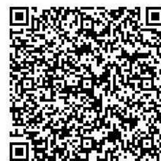
登録用 QR コード