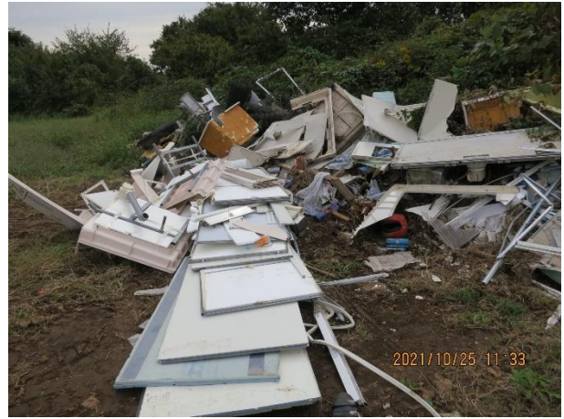
三箇地内 解体ごみ 三箇地内