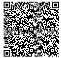
通報用二次元コード

⇒ 電話，F A X，電子申請（通報システム）がご利用できます。電子申請はスマートフォンなどから送信できます。電話の場合は，平日 8 時 30 分から 17 時までとなります。