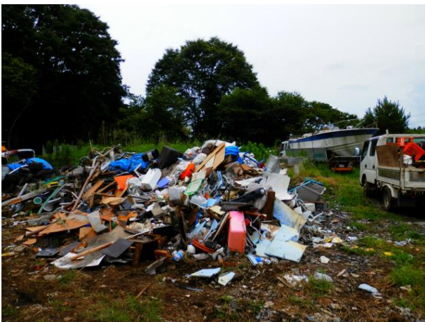
中野谷地内 解体ごみ 民地