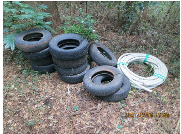
寺崎地内 タイヤ等 山林