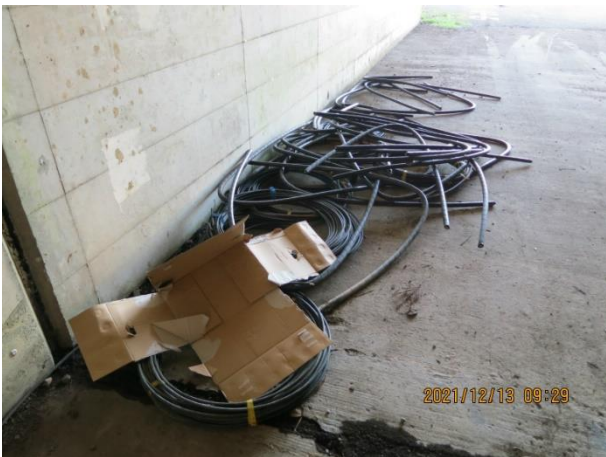
羽刈地内 高速隧道 ケーブル類