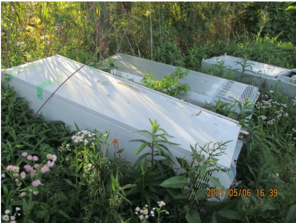
下吉影地内 家電 山林