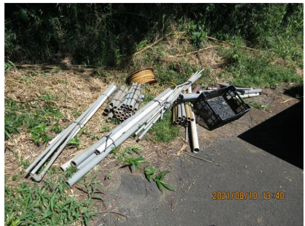
与沢地内 塩ビ管等 農道