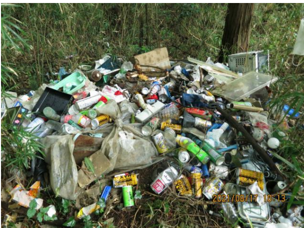
下吉影地内 生活ごみ 山林