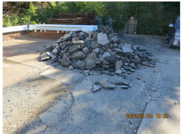
中野谷地内 ガラ 民地 (幹線道路脇)