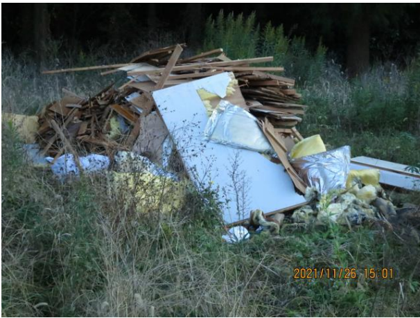
山野地内 解体ごみ 民地