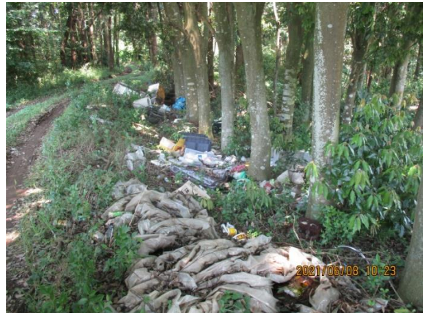
上合地内 片付けごみ 生活道