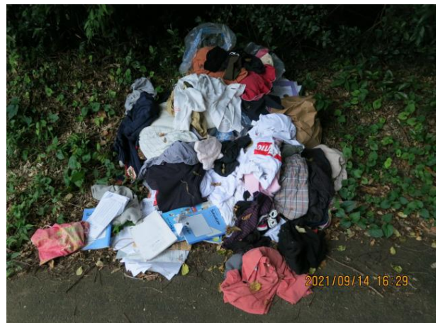
柴高地内 古着類 生活道路