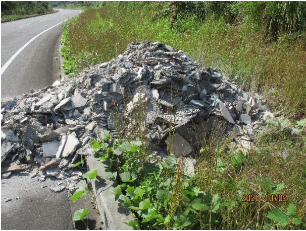
建築廃材 テクノパーク内道路