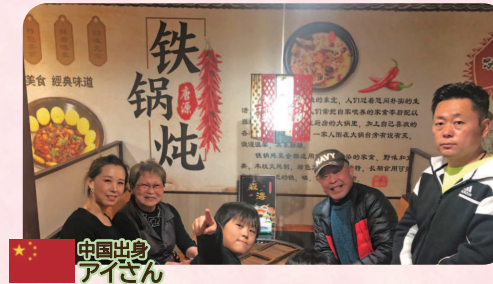
中国出身 アイさん