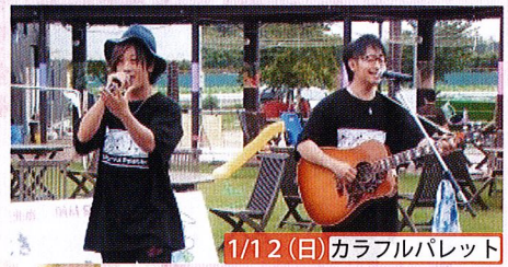
1/12 (日) カラフルパレット