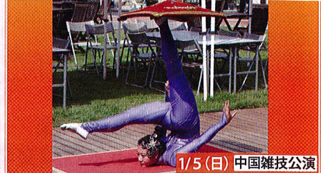
1/5 (日) 中国雑技公演