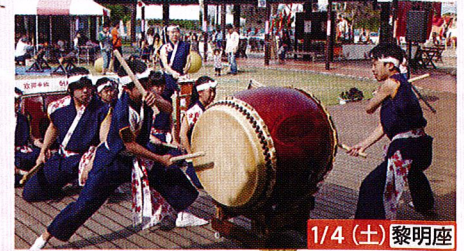
1/4 (土) 黎明座