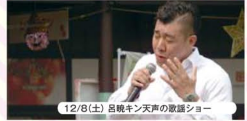
12/8(土) 呂曉キン天声の歌謡ショー