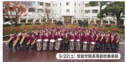
9/22(土) 常総学院高等学校吹奏楽部