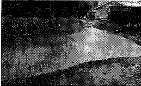
平成29年8月15日11時 撮影