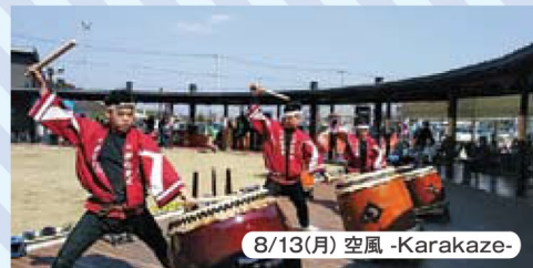
8/13(月) 空風 -Karakaze-