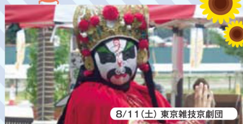
8/11(土) 東京雑技京劇団