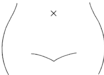
(腸瘻及びびらんの部位等を図示)