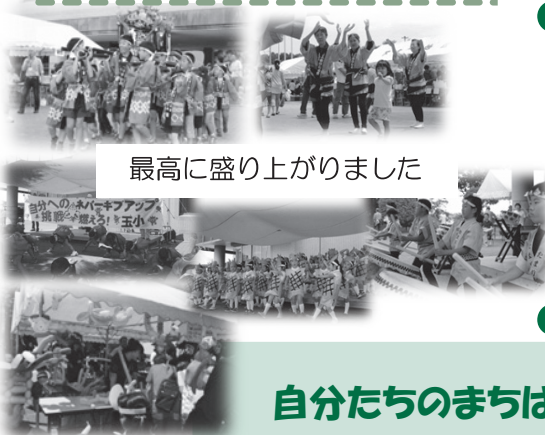
最高に盛り上がりました

5月28日（日） *玉里小学校区コミュニティ 『地域交流まつり』 （生涯学習センターコスモス）