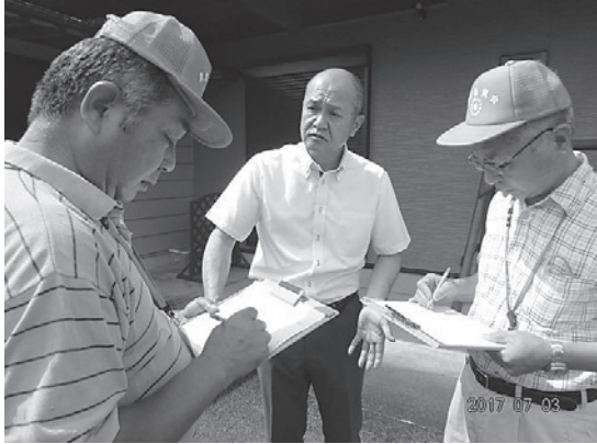
貸し手との戸別訪問相談

農地の貸借等での相談・訪問を希望される際には、農業委員会または農業委員および農地利用最適化推進委員へご相談ください。