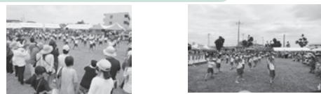
皆満面の笑顔です