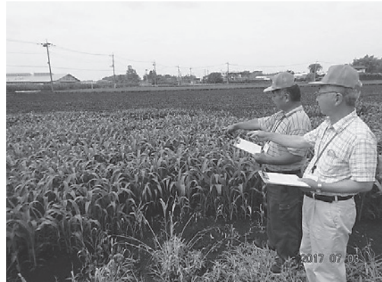
貸し手の農地確認