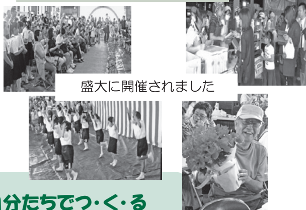
盛大に開催されました

6月3日（土） *納場地区コミュニティ 『ふれあいまつり』 （JA美野里農産センター）