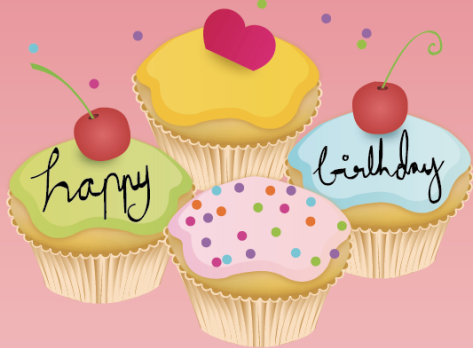
Omitama Guide Map