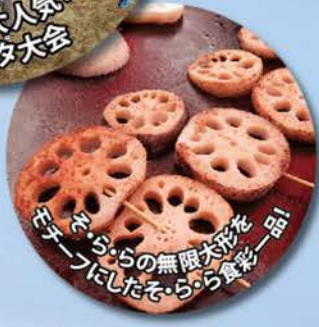
そららの無限大彩花を お菓子一品に 仕上げました