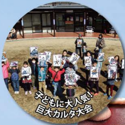
子どもに大人気!! 巨大カルタ大会