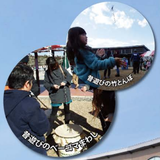
昔遊びの竹とんぼ