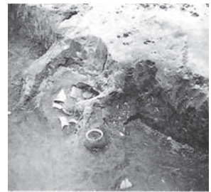
羽黒遺跡住居址カマドから出土した土器(美野里)

会 期 10月1日(日)まで 場 所 玉里史料館 展示室 閉館時間 午前9時30分～午後6時 休 館 日 月曜日、祝日(月曜日が祝日の場合、その翌日も休館) 入 館 料 無料 問い合わせ 玉里史料館 ☎26-9111