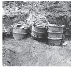
地藏塚古墳の埴輪列(小川)

玉里史料館では、平成18年度参考展示「小川・美野里の遺跡」を開催中です。小川地区は、昔、海だった霞ヶ浦に近く、美野里地区は内陸部に位置しています。このような地理的な条件を持つ両地区では、それぞれ特色ある遺跡が多く所在します。今回は、そうした小川、美野里地区の遺跡を紹介し、小美玉市の歴史を考えていきます。