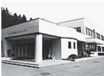
小川保健相談センター