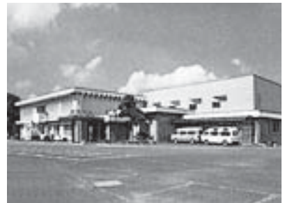
玉里保健福祉センター

【問い合わせ】 健康増進課(四季健康館内) ☎: 48-1111 (内線 4001)