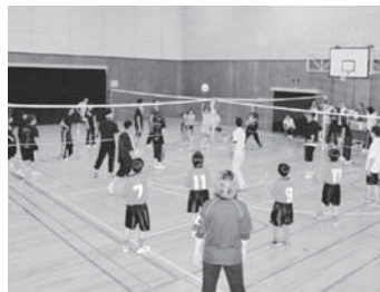
4コートバレーボール