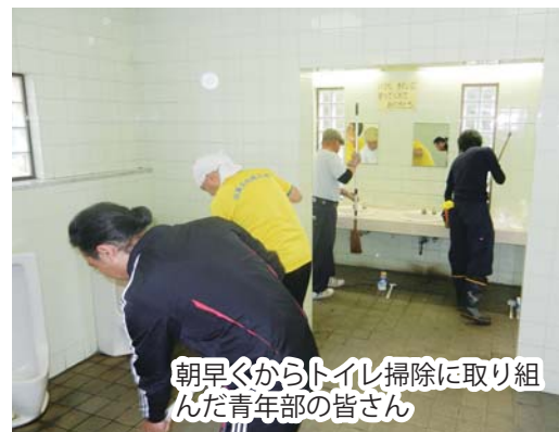
朝早くからトイレ掃除に取り組んだ青年部の皆さん

当日は午前6時から22名の部員が集まり、地域の方に気持ちよくトイレを使ってもらおうと、すみずみまで清掃を行いました。今後も地域発展のために商工会青年部はさまざまな活動をしていきます。