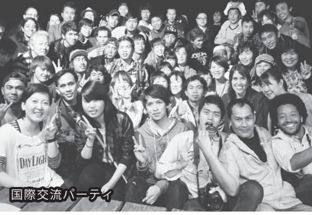
国際交流パーティ

【地縁型「コミュニティ」】 町内会・自治会など地域に根ざした活動を行っている団体を目指し、一般に地域に密着した様々な活動を担います。