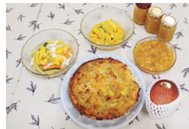
摘果マンゴーを使った料理各種 マンゴーのピクルス(左)、マンゴーの砂糖漬け(上)、マンゴージャム(右)、マンゴータルト(下)