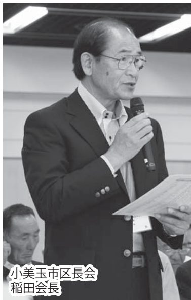
小美玉市区長会 稲田会長