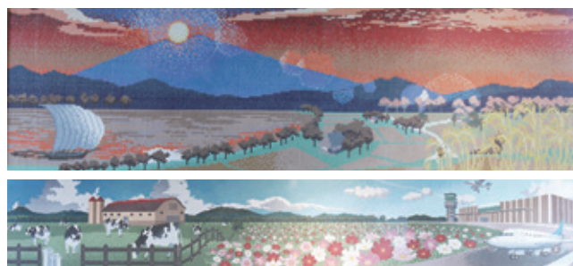
羽鳥駅に掲げているモザイクアート壁画 上: 霞ヶ浦から望むダイヤモンド筑波 下: 牧場・コスモス畑・茨城空港