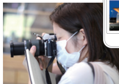
タウンジャーナル小美玉の羽鳥駅特集記事ページはこちら ▶