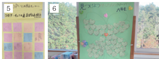
1 いじめSTOP宣言づくり 2 いじめSTOP集会を進行する運営委員 3 いじめSTOP集会の各クラスの様子 4 各クラスのいじめSTOP宣言 5 保健委員会からの呼びかけ 6 見つけよう私たちのクローバー

コロナ禍で活動が制限される中、よりよい堅倉小をつくらうという思いは、5・6年生で組織される運営委員会を中心に引き継がれてきました。「いじめを未然に防ぐ」というテーマのもと、「相手に優しく思いやり名人」を目指しながら、次のような企画を行いました。