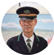
(株)JR東日本ステーションサービス 水戸支店 土浦駅務管区 駅長(羽鳥駅・岩間駅)