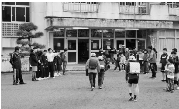
小中合同あいさつ運動