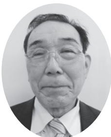
朝倉 実行 美野里地区