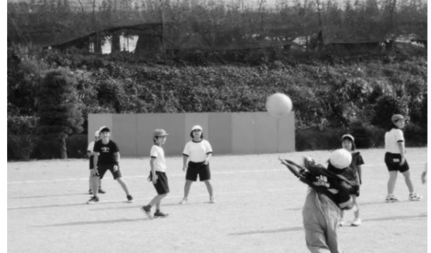
縦割り班での遊び