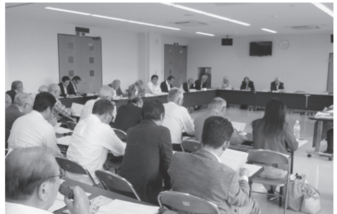
申請者による補助金申請事業説明