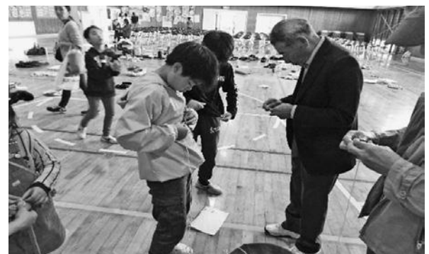
親子 3 世代交流玉北ハート集會